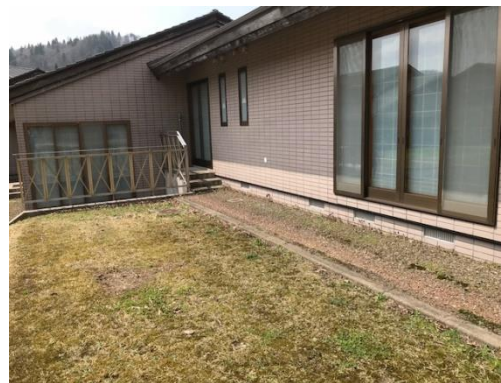
③足洗い場のスペース