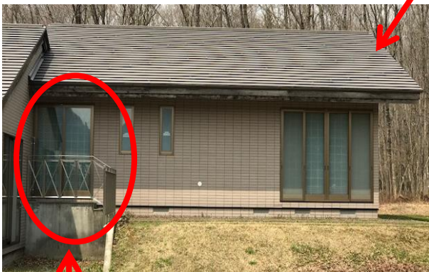
小型犬の出入り口場所